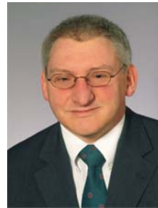
Wahlbezirk 04 Blindenschule Andreas Kappelhoff Dipl.-Ing.