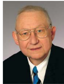
Wahlbezirk 14 Kindergarten Gotlandweg / Joh.-Grundschule Horst Hahn , Betriebswirt